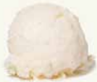
Noix de Coco