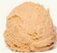
Caramel beurre salé